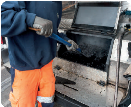
④ Ajout de nouveaux matériaux