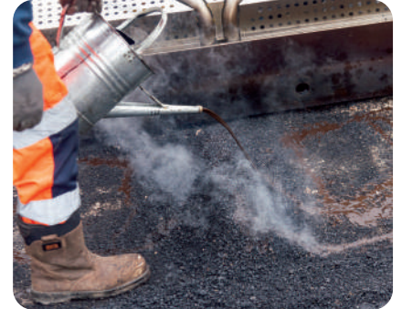
③ Ajout de régénérant