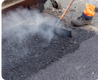
② Scarification des enrobés