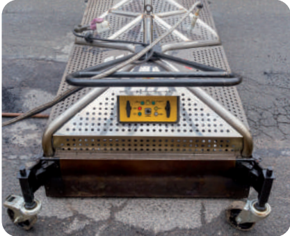
① Lancement du cycle de chauffe du support