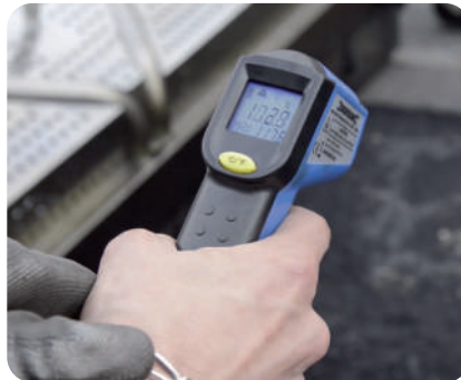
⑤ Vérification température