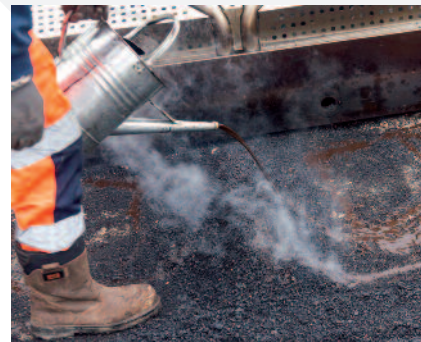
3 Ajout de régénérant