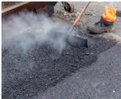
2 Scarification des enrobés