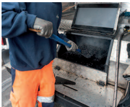
4 Ajout de nouveaux matériaux