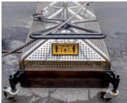
1 Lancement du cycle de chauffe du support