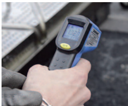
5 Vérification température