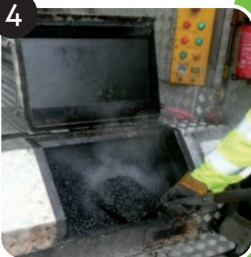
Ajout de nouveaux matériaux