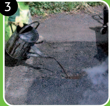
Ajout de régénérant